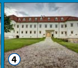
4 Grad Negova