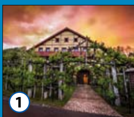
1 Hiša penin "Frangéž"