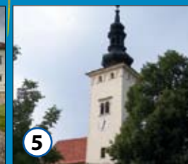
5 Marijina cerkev v Negovi