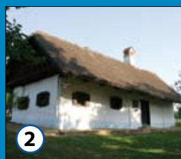
2 Dajnкова domačija