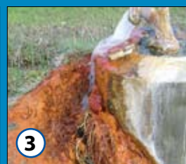
3 Pot med vrelci življenja